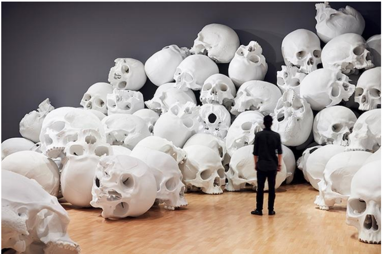
Ron Mueck, Mass (2016-2017)

"Faire du théâtre, c'est forcément s'opposer à cette volonté d'uniformiser le monde. C'est entretenir par la mise en valeur des défauts, des soi-disant tares de chaque individu, un espoir de poésie et de différence."