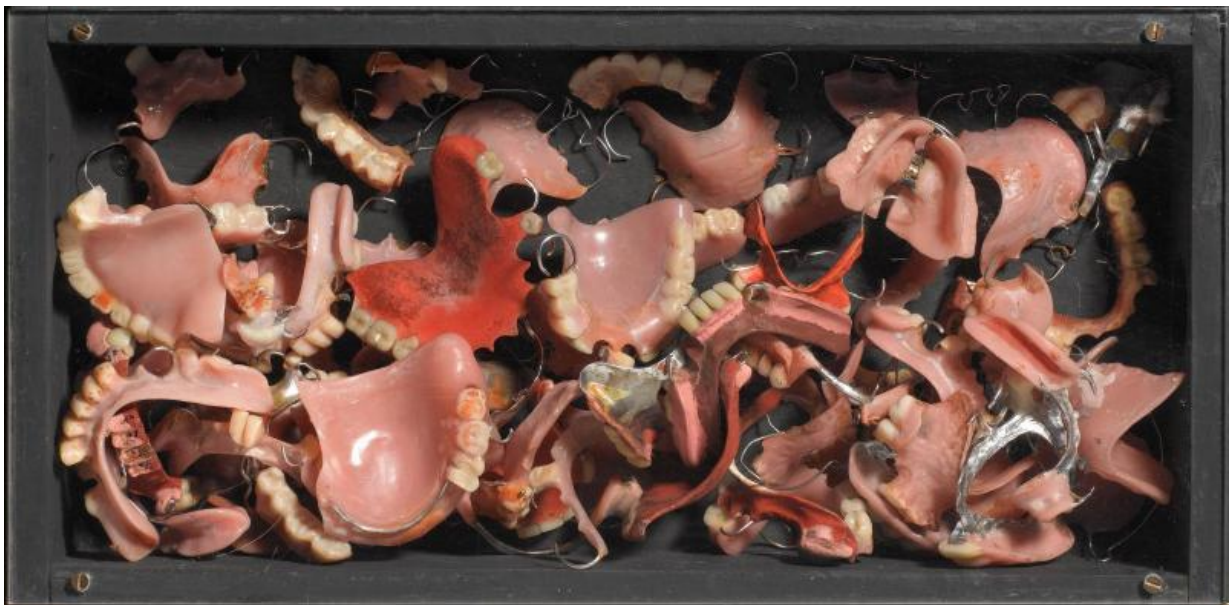
Arman, La vie à pleines dents (1960) – Centre Pompidou

Mais la valeur de Lette sur le marché s'effondre rapidement au moment où il se retrouve face à plusieurs répliques de lui-même. Il est devenu une norme de beauté. Son chirurgien utilise son image comme une marque déposée.